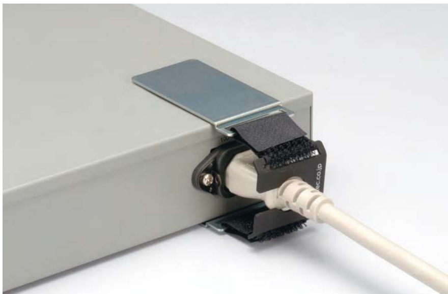
ハブへ装着 Attached to Hub