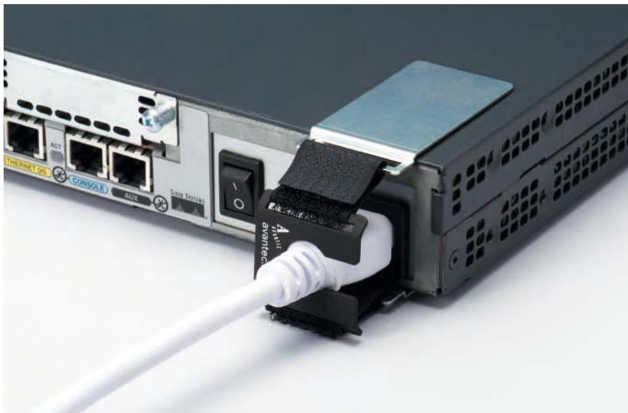
海外製ルータに装着 Attached to overseas made router